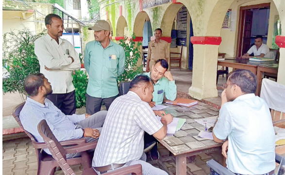
हरिभूमि न्यूज ललितपुर

मध्यप्रदेश की सीमा से सटा तहसील मड़वारा क्षेत्र में रसायनिक खाद की कालाबाजारी बड़े पैमाने पर होने के चलते सुर्खियों में बना है। यहाँ खाद की कालाबाजारी का खेल लम्बे समय से चल रहा है। बीती देर रात्रि बुधवार को उपजिलाधिकारी मड़वारा ने चेकिंग के दौरान प्रवि पेट्रोल पंप के पास से मध्यप्रदेश जा रहे रासायनिक खाद से लदी डीसीएम ट्रक को ट्रैक्टर में खाद पलटी करते समय पकड़ लिया। मौके पर किसी भी प्रकार के प्रप्रत्र नहीं मिलने पर थाना मड़वारा के सुपुर्द कर दिया खाद। खाद की कालाबाजारी होने की असंका के चलते जिले के कृषि विभाग के उच्च अधिकारियों को जांच करने के उपजिलाधिकारी ने निर्देश दिये। कृषि विभाग के आला अधिकारियों ने थाना मड़वारा आकर रासायनिक खाद जांच की गई। मामले को लेकर कृषि अधिकारियों ने अग्रिम