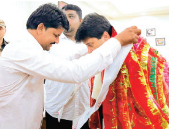
हरिभूमि न्यूज़ ▶▶ राजगढ़