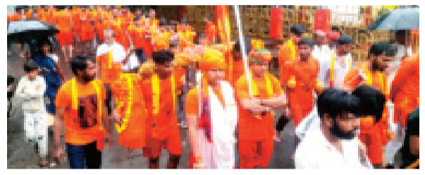
हरिभूमि न्यूज़ ▶▶ राजगढ़

वीर खेड़ापति हनुमान मंदिर समिति के तत्वावधान में लगातार आठवें वर्ष भव्य कांवड़ यात्रा का आयोजन करवाया गया। करीब पांच दिनों तक उज्जैन से राजगढ़ तक की इस पैदल कांवड़ यात्रा में समिति के करीब 70 से अधिक युवा सम्मिलित थे। उज्जैन से प्रवाहित क्षिप्रा मैया का जल कांवड़ में भरकर श्रद्धालु युवाओं का यह दल बुधवार शाम नगर में पहुंचा। मंदिर में रात्रि विश्राम उपरान्त गुरुवार को ढोल-ढमाकों के साथ नगर के मुख्य मार्गों से होकर कांवड़ यात्रा निकाली गई। इस दौरान नगर के विभिन्न शिवालयों में पहुंचकर कांवड़ियों ने क्षिप्रा मैया के जल से भगवान भोलेनाथ का अभिषेक पूजन किया। कांवड़ यात्रा का समापन खोयरी स्थित बैजनाथ महादेव धाम पर हुआ जहां सभी ने भगवान बैजनाथ का अभिषेक, पूजा इत्यादि करते हुए महाअरती की। इसके उपरान्त सभी भक्तों को महाप्रसादी का वितरण करवाया गया।